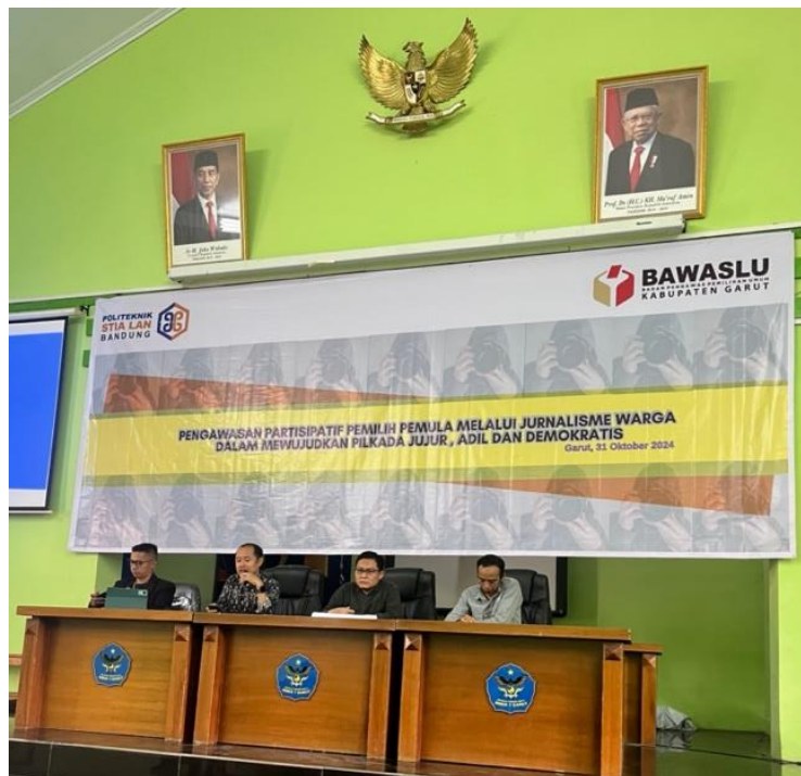
Gambar 3. Pemaparan Materi oleh Narsumber

Sehingga dengan dilaksanakannya kegiatan ini besar harapan kami bahwa para siswa-siswi yang hadir mau mencoba dan menerapkan materi yang telah didapatkan dalam masa persiapan serta pelaksanaan Pilkada serentak tahun 2024 ini. Program ini diharapkan mampu memberikan kontribusi nyata dalam meningkatkan partisipasi pemilih pemula di Kabupaten Garut dalam Pilkada 2024. Dengan kemampuan jurnalistik yang telah dimiliki, peserta diharapkan dapat menjadi agen perubahan yang aktif dalam mengawasi proses pemilu dan menyebarkan informasi yang valid kepada masyarakat. Dalam konteks Pilkada, peran ini sangat penting untuk mencegah penyebaran hoaks dan meningkatkan kepercayaan masyarakat terhadap hasil pemilu. Dari sisi teoritik, program ini memberikan kontribusi terhadap pengembangan keilmuan di bidang literasi politik dan pendidikan kewarganegaraan. Hasil yang diperoleh menunjukkan bahwa jurnalisme warga dapat menjadi strategi efektif untuk meningkatkan literasi politik di kalangan generasi muda. Temuan ini mendukung penelitian sebelumnya yang menyatakan bahwa keterlibatan aktif dalam proses jurnalistik dapat membantu individu memahami isu-isu politik secara lebih mendalam dan kritis.