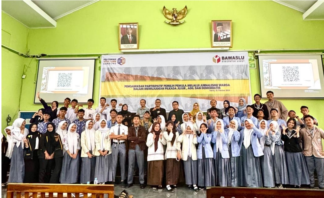
Gambar 2. Foto Bersama Seluruh Peserta Kegiatan

Pelaksanaan program terdiri dari beberapa tahapan utama. Tahap pertama adalah perencanaan, yang melibatkan identifikasi kebutuhan pemilih pemula berdasarkan kondisi lokal Kabupaten Garut serta penyusunan materi yang relevan dengan konteks Pilkada 2024. Tahap kedua adalah pelaksanaan seminar dan diskusi interaktif antara peserta dan narasumber, yang bertujuan untuk mengkaji isu-isu aktual terkait Pilkada dan memberikan ruang bagi peserta untuk menyampaikan pandangan serta bertanya langsung kepada narasumber. Lalu tahap ketiga adalah Deklarasi Pemilih Pemula untuk Pilkada Jujur Adil dan Demokratis, serta penandatanganan Jaringan Pengawas Partisipatif Pemilih Pemula untuk Demokrasi (JP4D) oleh para peserta.