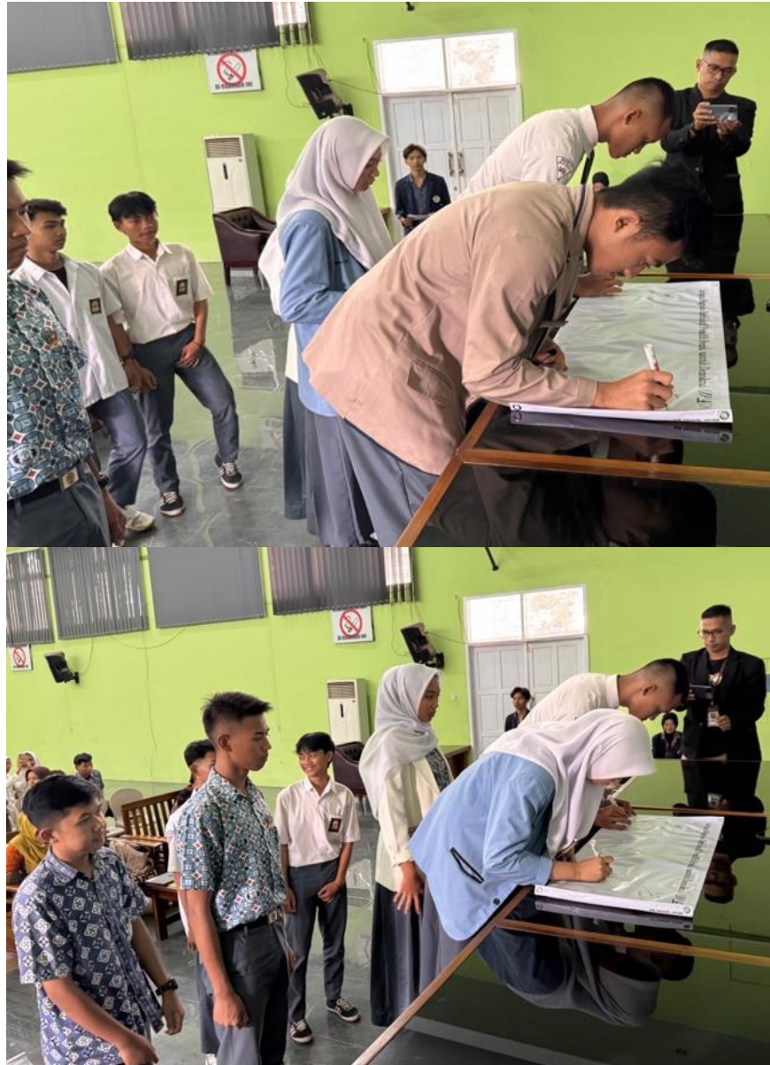
Gambar 6. Penandatanganan JP4D

pelaksanaan Pilkada yang bebas dari politik uang, hoaks, dan isu SARA. Penandatanganan dilakukan pada spanduk besar yang berisi pesan-pesan demokrasi, yang selanjutnya akan dipajang sebagai pengingat dan motivasi bagi komunitas sekolah untuk terus berperan aktif dalam menjaga integritas demokrasi. Kegiatan ini tidak hanya menjadi simbol formal komitmen generasi muda, tetapi juga menjadi momen inspiratif yang memperkuat kesadaran kolektif akan pentingnya partisipasi aktif dalam pengawasan Pilkada.