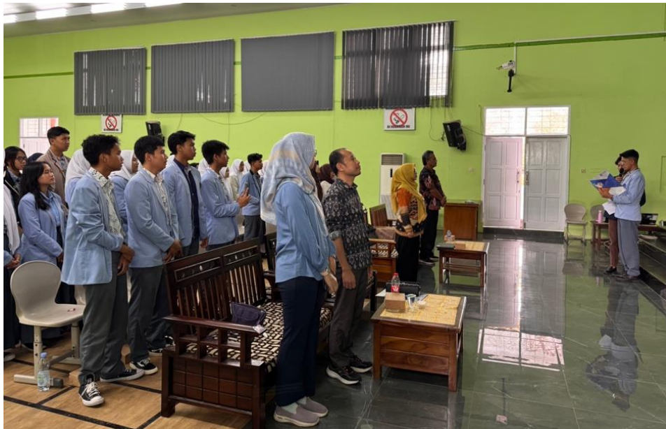
Gambar 5. Pembacaan Deklarasi Pemilih Pemula

Setelah deklarasi, seluruh peserta turut serta dalam penandatanganan komitmen sebagai Jaringan Pengawas Partisipatif Pemilih Pemula untuk Demokrasi (JP4D) sebagai simbol dukungannya terhadap