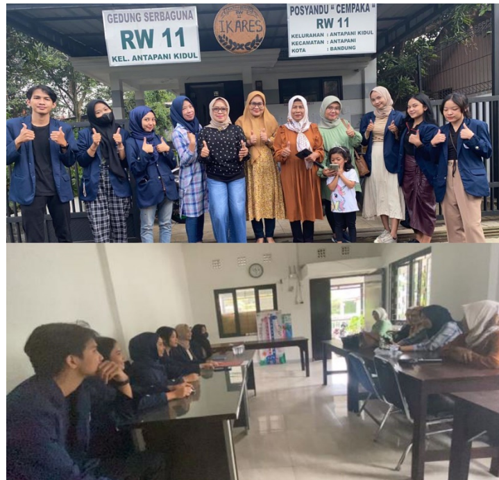
Gambar 1 Kegiatan sosialisasi dan wawancara mengenai pendataan balita di Posyandu Cempaka