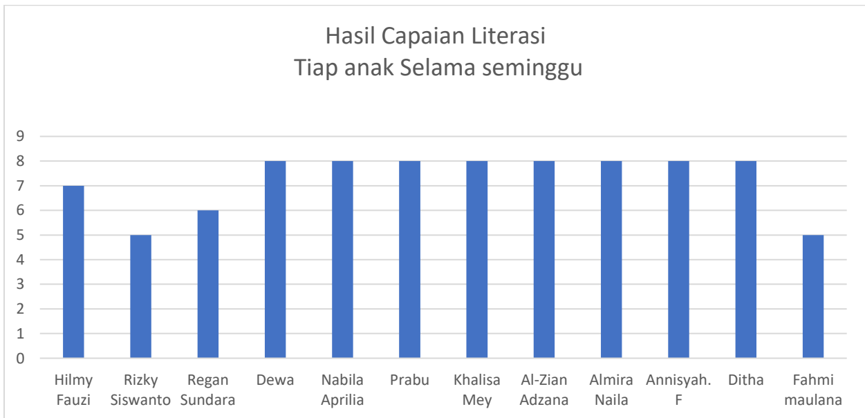
Grafik 1. Grafik Capaian Literasi

Berdasarkan hasil laporan tersebut kami mendapatkan hasil progres literasi dari setiap anak dan hasil tersebut dapat dilihat melalui lebih jelas melalui grafik sebagai berikut: