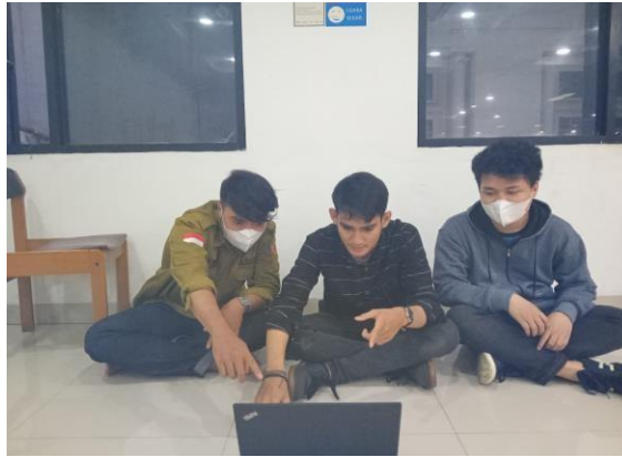
Gambar 3. Sinkronisasi Data Kegiatan Organisasi Mahasiswa

SINDAWA tersebut, dilihat dari terisinya excel SINDAWA yang dibuat untuk mencantumkan kegiatan-kegiatan yang dilakukan oleh organisasi mahasiswa di lingkungan Politeknik STIA LAN Bandung. Seluruh tahapan yang direncanakan berjalan sesuai dengan apa yang sudah direncanakan sebelumnya, karena seluruh stakeholder dengan terbuka mau membantu.